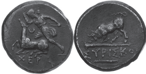
Abb. 1: Æ Dichalkon, OV: Parthenos als ἐλαφοκτόνος l. darunter ΧΕΡ(σονασιτᾶν), RV: Stier über Keule l. im Abschnitt der Name ΣΥΡΙΣΚΟ über Köcher und Bogen (Verwendung der Photographie mit freundlicher Genehmigung des Kölner Münzkabinetts Tyll Kroha Nachfolger).

Chersonesiten gewährt worden seien, einigermaßen entbehrlich, da doch in IOSPE 3 III 1 offenbar keine einmaligen, mit konkreten Taten verbundene Hilfeleistungen gemeint sind, wobei man eine nehmende und eine gebende Partei anzunehmen geneigt wäre, sondern die bestehenden (ὑπάρξαντα) außenpolitischen Verhältnisse, die guten wechselseitigen Beziehungen der Chersonesiten zu (ποτί) anderen Poleis und den Bospornischen Königen. Im Dekret nehmen Rat und Volk (bzw. die Antragssteller) ohne Weiteres Subjektfunktion ein und erwähnen folglich die von φιλανθρωπία bestimmten Beziehungen zu anderen, ohne damit indizieren zu wollen, dass hier irgendein einseitiges, allein von den Chersonesiten gepflegtes Verhältnis vorläge.