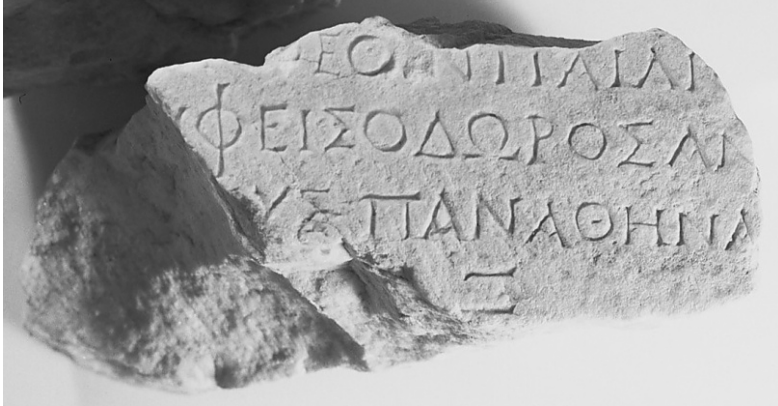
zu K. Hallof, S. 42 IG II/III 3 4, 1397 Fr. g.