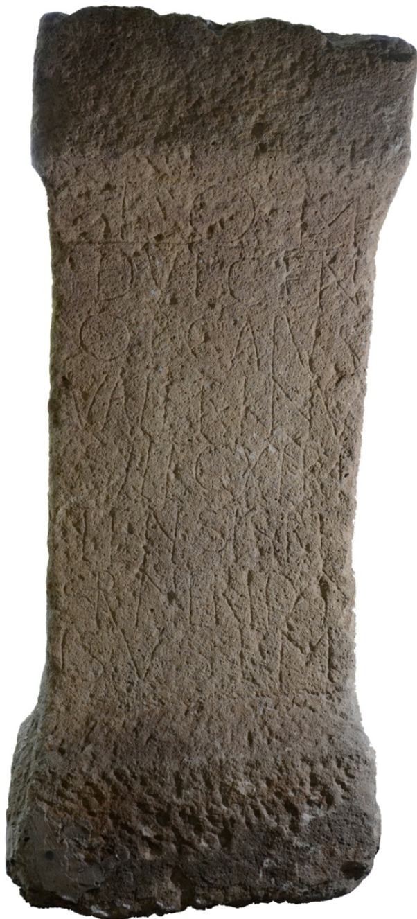
zu I. Piso, G. Cupcea S. 115–146, Abb. 1