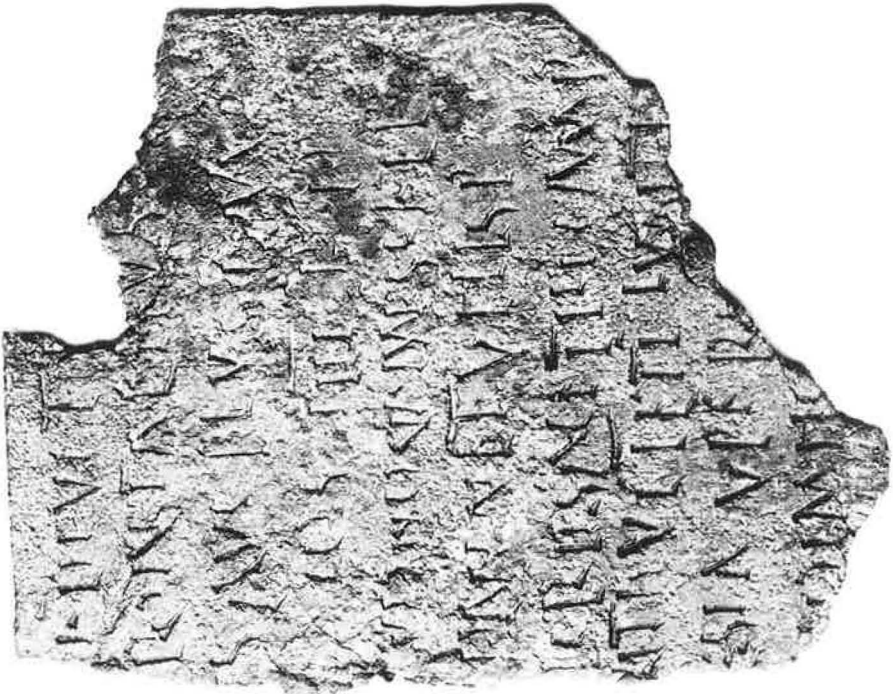
a) zu Schindler, Nr. 2 ext., S. 224f.