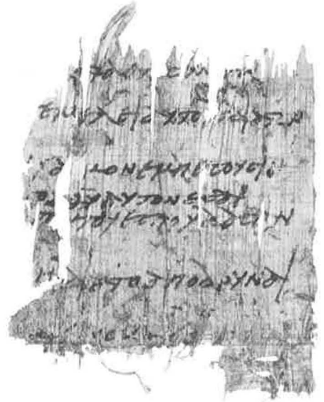
Sijpesteijn, Nr. 2 (S. 156f.)