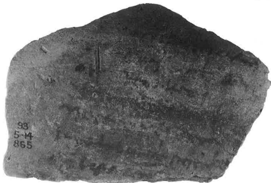
Purola, „Rekto“ (S. 125ff.)