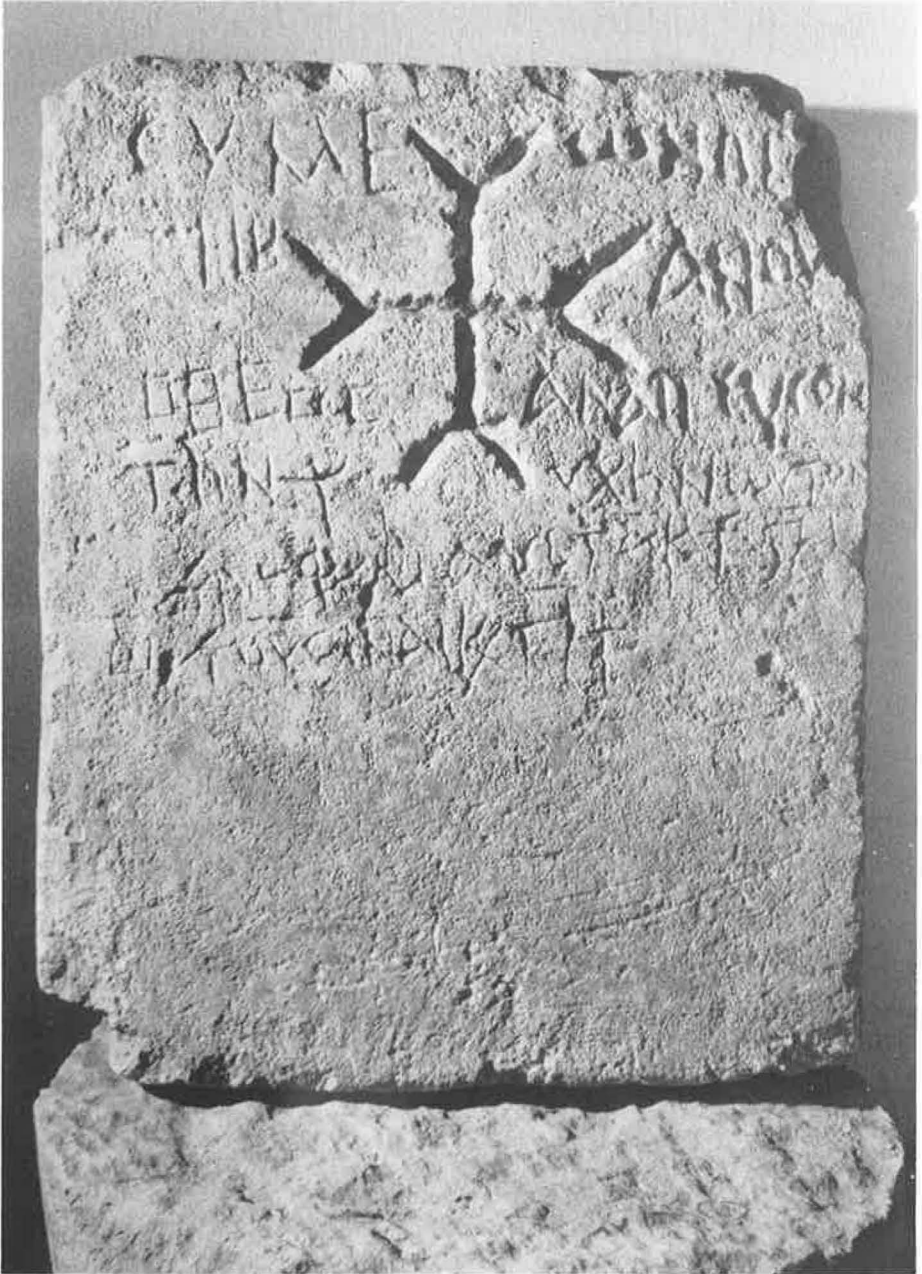
Harrauer, Tauber, Nr. 2 (S. 32f.)