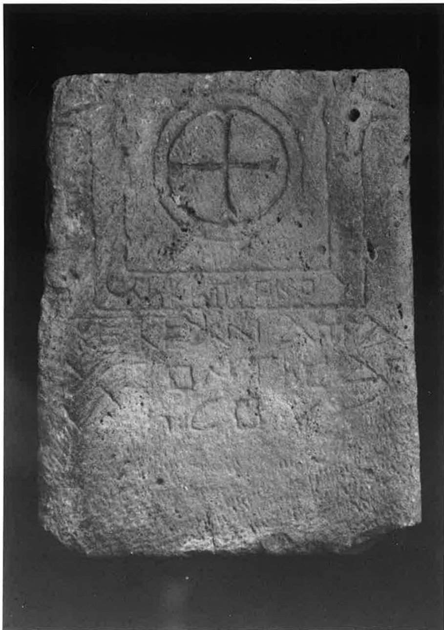
Harrauer, Taeuber , Nr. 1 (S. 31f.)