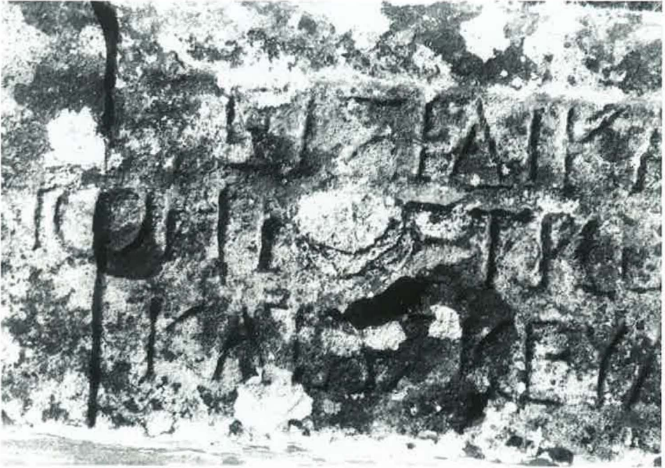
Chaniotis, Rethemiotakis Nr. 8 (S. 37f.)