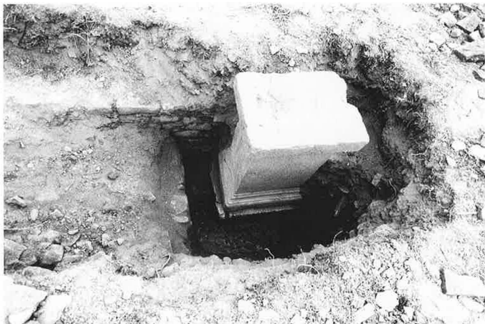
Chaniotis, Rethemiotakis Nr. 2 (S. 29f.)