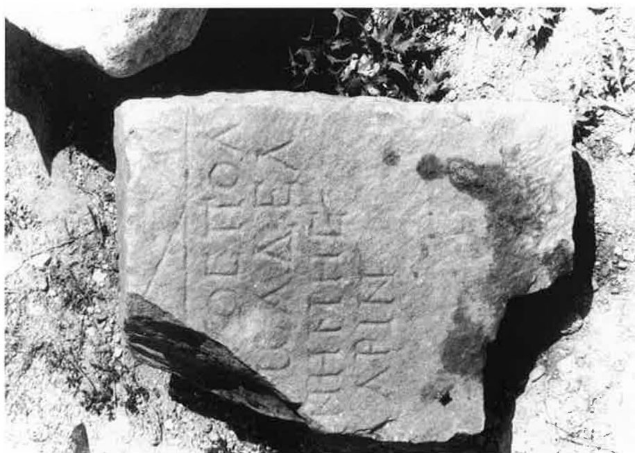
Chaniotis, Rethemiotakis Nr. 6 (S. 36)