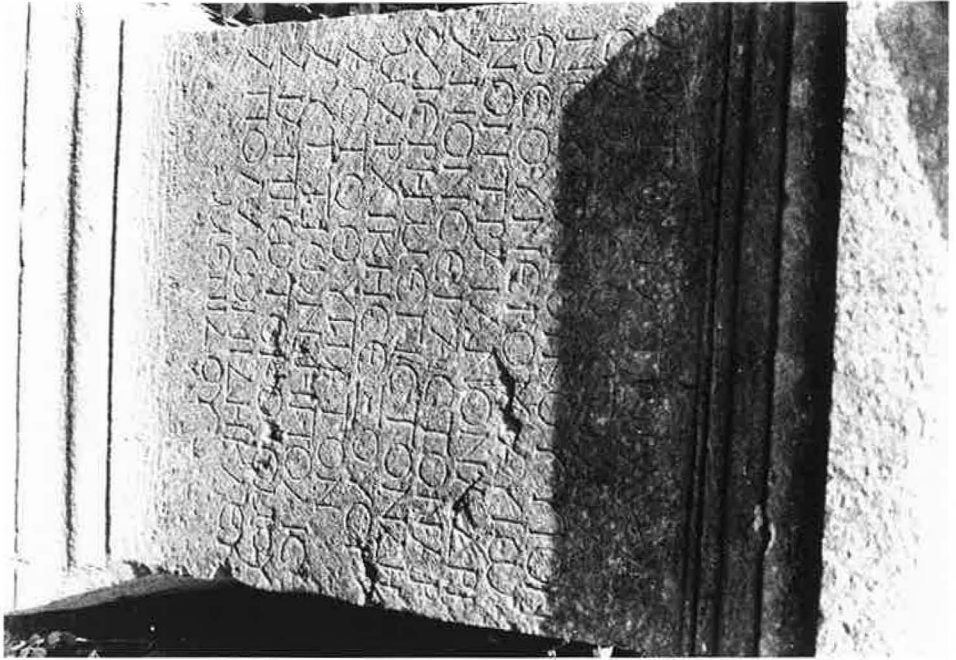
Chaniotis, Rethemiotakis Nr. 1 (S. 29)