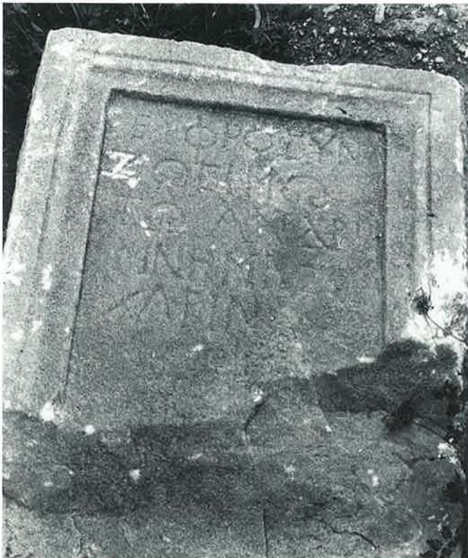
Chaniotis, Rethemiotakis Nr. 7 (S. 36f.)