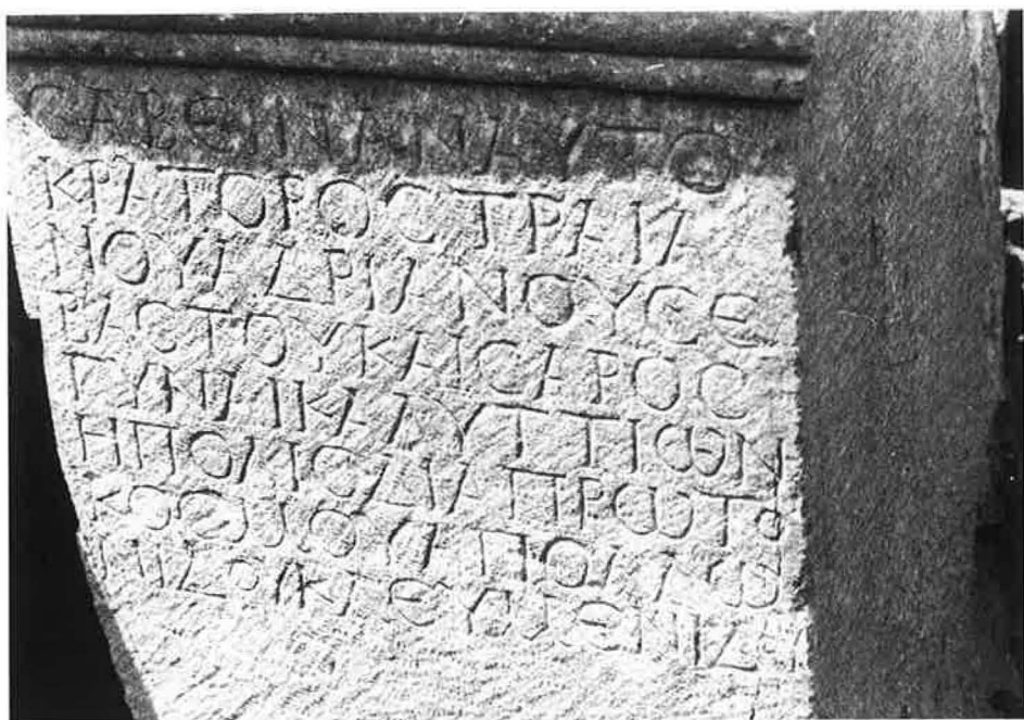
Chaniotis, Rethemiotakis Nr. 5 (S. 30ff.)