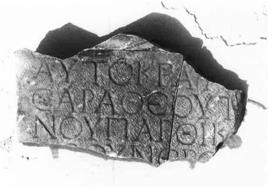
Chaniotis, Rethemiotakis Nr. 4 (S. 30)