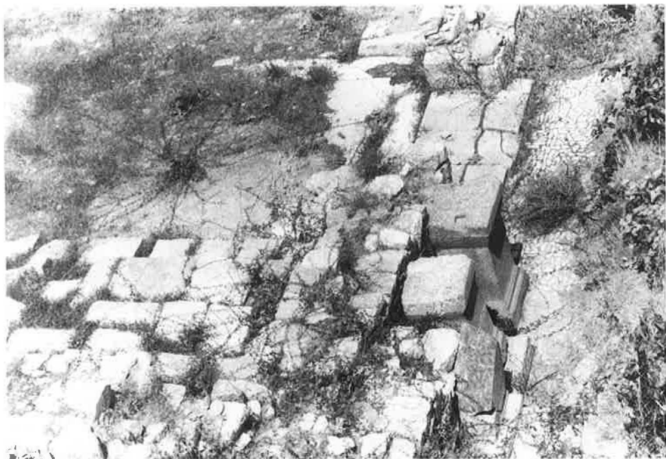
Chaniotis, Rethemiotakis (S. 27ff.)